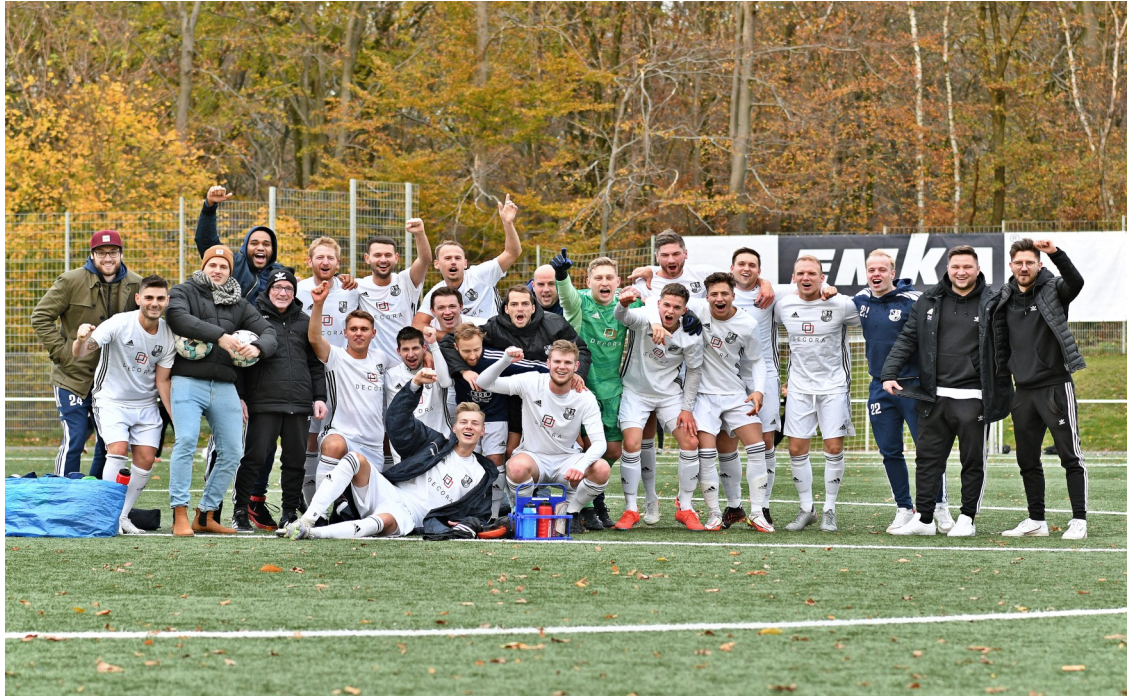
Jubel auf dem Freudenberg nach dem gewonnen Derby gegen den SC Sonnborn 07

Unsere 1. Mannschaft überwintert in der Bezirksliga auf dem 6. Tabellenplatz und hat das Potenzial in der Top-Drei mitzumischen. Das hat die Partie gegen den Aufstiegsaspiranten DJK Adler Union Frintrop gezeigt. Was für ein spannendes Match wurde am 28. November in der Germanen-Arena geboten! Beim Schlusspfiff ging dann doch beim 1:2 der Favorit als Sieger vom Platz. Nun gilt es Anlauf nehmen für die Rückrunde. In diesem Jahr sogar mit wenig Auftritten in der Halle. Beim Südhöhenturnier wollten die Germanen einen guten Auftritt haben. Schließlich kann man beim SSV Germania ein Hallen-Team aus Spielern der vier Mannschaften aufstellen. Leider erreichte uns Anfang Dezember die Nachricht der erneuten Absage des geselligen Budenzaubers in der Cronenberger Alfred-Henckels Halle.