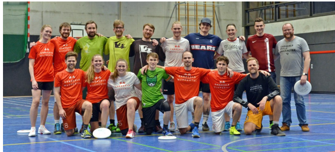
Foto vom 24. November 2021 beim gemischten Training in der Halle Unterdörnen

Dazu zählen die Open - Caracals Herren, das Damen-Team, das Mixed-Team und die Caramba-Kinder