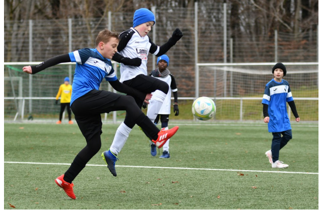
Foto: Unsere D-junioren in der Germanen-Arena im Spiel gegen den SSV 07 Sudberg

Die letzten Spiele des Jahres 2021 werden mit Mütze, Handschuhen und langer Hose absolviert. Germanias Fußball-Jugend verabschiedet sich in die Winterpause.