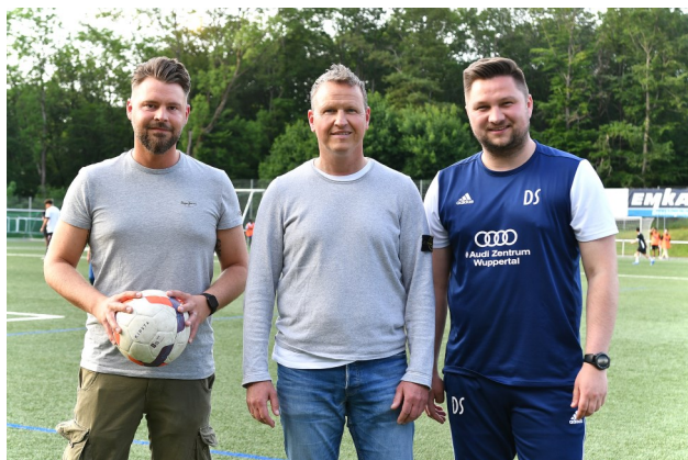
Neuer Trainer der 1. Fußballmannschaft. Mehr dazu auf der Seite 6

Lesen Sie mehr Informationen der Geschäftsführung