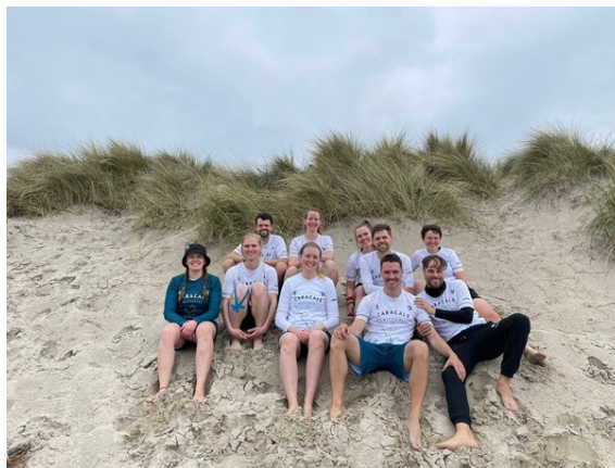
Caracals bei der Deutschen Beachmeisterschaft in Warnemünde

Für das Mixed-Team stand aber im Jahr eine weitere Herausforderung an. Die Caracals sind auch in der Beach-Division angetreten. Da wir hier in 2022 aber nicht in 2023 gespielt haben, musste in der untersten Liga, mit nur 4 Teams gestartet werden. Im Mai reisten dafür 10 SpielerInnen den weiten Weg an den Strand von Warnemünde, um bei Sonnenschein und turbulentem Wind die 175g leichte Frisbeescheibe in die Endzone zu befördern. Von den insgesamt 3 Vorrunden-Spielen konnten alle gewonnen werden. Somit stand der Einzug ins Halbfinale fest, wo gegen Bremen mit 13-2 trotz strakem Wind gewonnen werden konnte. Auch das Finale gehen die eigentlich windverwöhnten Kieler SpielerInnen gewann das Caracals-Mixed-Team mit 13-3. Das bedeutet für nächsten Sommer den Aufstieg in die 3. Liga mit 8 Teams.