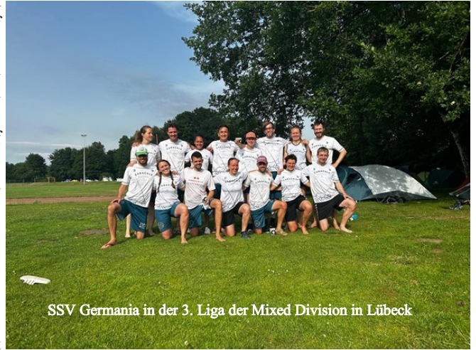
SSV Germania in der 3. Liga der Mixed Division in Lübeck

In der Mixed-Division auf Rasen traten die Damen und Herren gemeinsam auf Rasen in der 3. Frisbeeliga (von 4) an. An zwei Wochenenden im Juni in Braunschweig und im Juli in Lübeck kämpften die SpielerInnen gegen Teams u.a. aus Hamburg, Münster, Düsseldorf und Kiel um eine gute Platzierung. Insgesamt hatten die Caracals 8 Spiele zu absolvieren, von denen aber nur 3 gewonnen werden konnten. Am spannendsten gestaltete sich das Spiel gegen Hamburg, was am Ende mit einem 14 zu 13 gewonnen werden konnte. Am Ende bedeutete das den vorletzten Platz, womit der Abstieg gerade so verhindert werden konnte