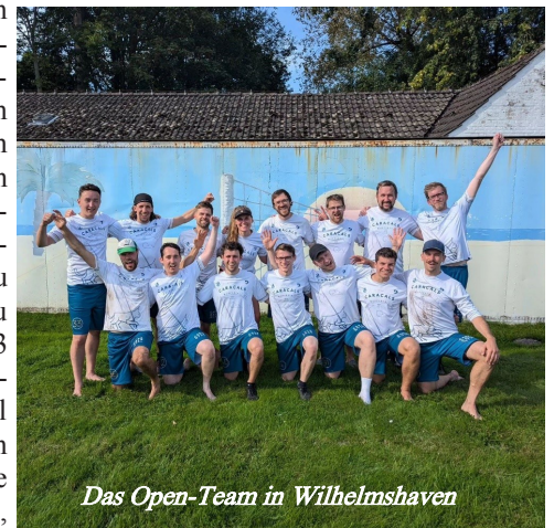
Das Open-Team in Wilhelmshaven

Das Herrenteam trug dann im August und Ende September die SSV-Trikots auf. Angetreten wurde dieses Jahr auch hier in der 3. Liga NW. Im August konnten in Aachen Siege gegen die Teams aus Hamburg, Duisburg und Aachen eingefahren werden. In einem spannenden Spiel gegen das Team aus Bochum verloren wir im entscheidenden Punkt 13 zu 12. Dem Favoriten, dem Team aus Bonn, konnten wir nichts entgegensetzen. In der Vorrunde verloren wir 15 zu 6. Am zweiten Spielwochenende in Wilhelmshaven galt es dann einen Sieg gegen das Heimteam einzufahren um in den oberen Pool zu gelangen und damit die Spiele um die Plätze 1 bis 4 zu spielen. Ein sehr enges Spiel konnten wir hier mit 15-13 für uns entscheiden. Dann stand im Halbfinale das Rematch gegen das Bochumer Team an, was wir dieses Mal 15-13 für uns entscheiden konnten. Das bedeutete den Finaleinzug gegen den Favoriten Bonn Sai: Im Finale schlugen wir uns deutlich besser als in der Vorrunde, kamen dem Sieg aber trotzdem nicht nahe. Mit einer 15 zu 10 Niederlage beendeten wir die 3. Liga auf Platz 2.