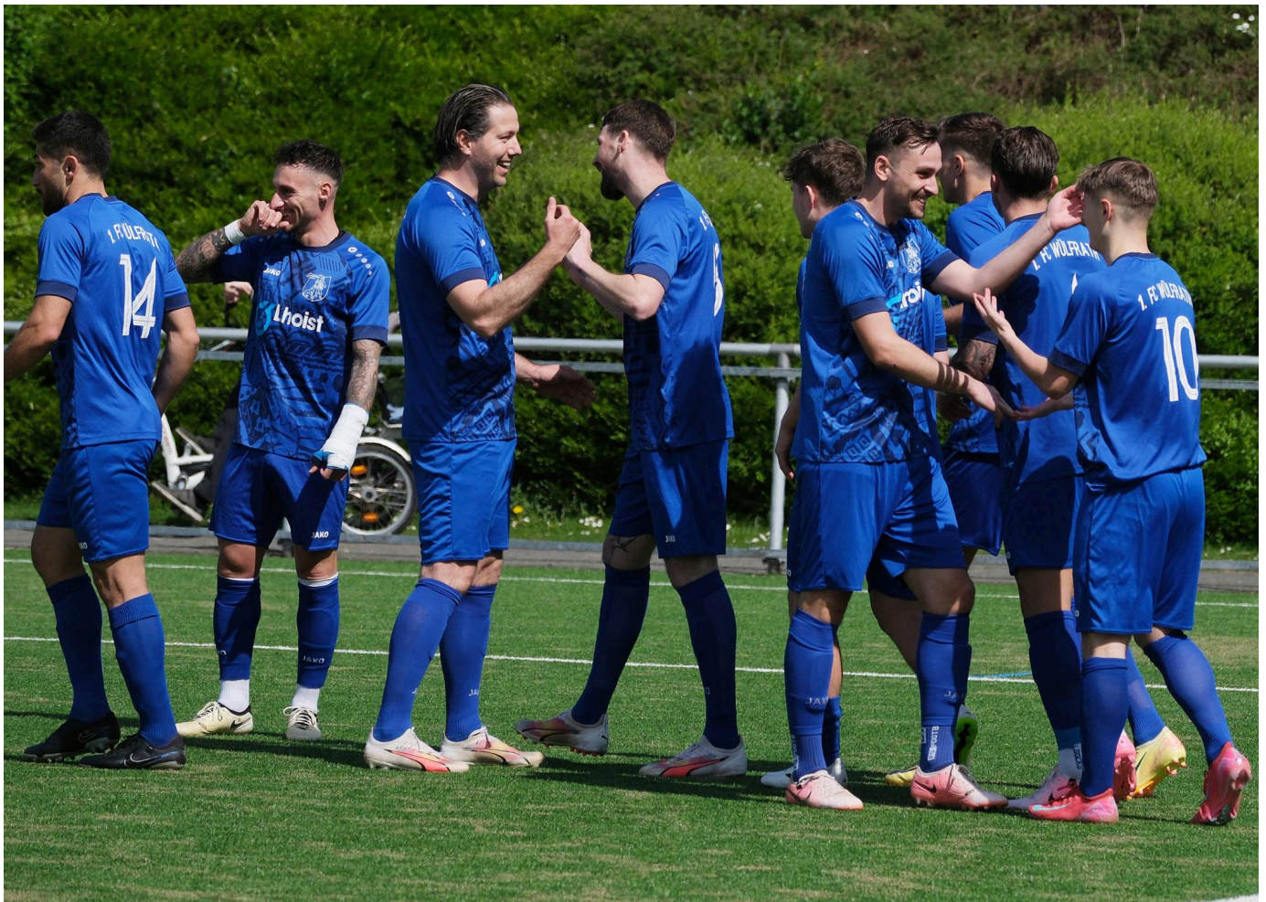
Die FCW-Fußballer feiern im Aufstiegsendspurt die nächsten drei Punkte.

04.05.2025 , 21:30 Uhr · 4 Minuten Lesezeit